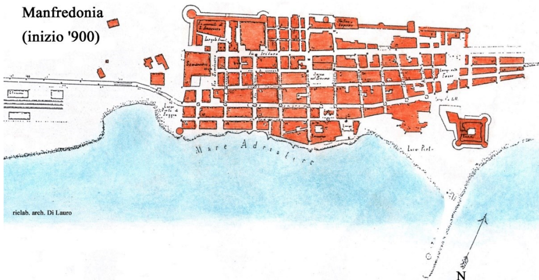
Fig. 3 Planimetria dell'abitato di Manfredonia all'inizio del Novecento.

La planimetria è stata elaborata e colorata dall'autore sulla base di una pianta topografica dell'abitato ai primi del Novecento con la dislocazione dell'impianto di illuminazione pubblica della città. Si noti l'andamento della costa rocciosa che è rimasto pressoché immutato sin dai tempi del Casale Siponto. La linea costiera sarà modificata solo alla fine degli anni venti del secolo scorso quando inizieranno i lavori per l'ampliamento e la sistemazione del porto.